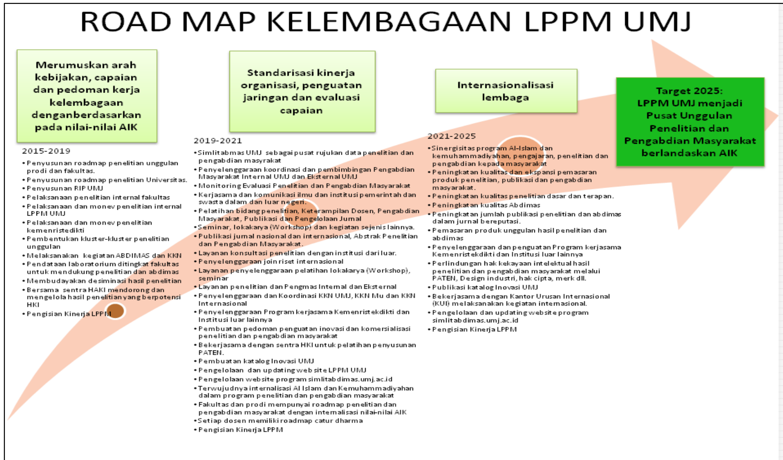
Gambar 1. Road Map LPPM UMJ Tahun 2020-2025